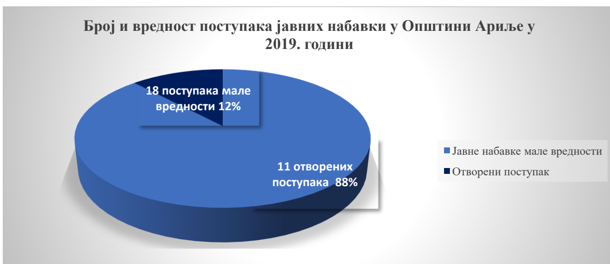
Графикон број 1: Структура уговорене вредности јавних набавки према врсти поступака у 2019. години

План набавки за 2019. годину усвојен је од стране начелника Општинске управе, који у складу са чланом 51 став 1 Закона о јавним набавкама садржи све прописане елементе. Општина Ариље је у 2019. години, спровела 28 поступака од чега је 11 поступака спроведено у отвореном поступку, 18 поступака јавне набавке мале вредности и 24 набавке на које се закон не примењује али су примењени исти принципи као и код поступака мале вредности (позив на адресе три понуђача, најнижа цена, уговорена вредност, начин плаћања, као и ограничења да без сагласности Одељења за буџет и финансије није могуће покренути набавку). Укупно уговорена вредност у отвореним поступцима износи 153.785.151 динара без ПДВ-а, односно 192.408.133 динара са ПДВ-ом. Укупно уговорена вредност у јавним набавкама мале вредности износи 23.294.466 динара без ПДВ-а, односно 26.287.551 динара са ПДВ-ом. Уговорена вредност у поступцима набавке на које се закон не односи износи 7.282.219 динара без ПДВ-а, односно 7.901.994 динара са ПДВ-ом.