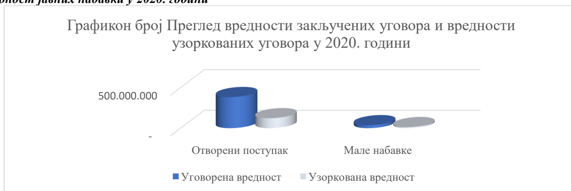
Графикон број 4: Уговорена вредност узоркованих јавних набавки у односу на укупно уговорену вредност јавних набавки у 2020. години

1) Јавна набавка број 404-12/2020, Радови на изградњи, обалоутврде водотока, уређењу Латвичког потока, потока Студенац, Миросаљачког потока и Пантића потока на територији општине Ариље